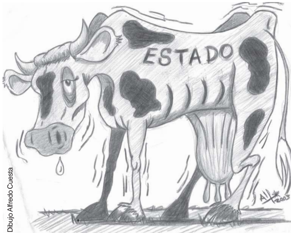
Dibujo Alfredo Cuesta

Seguramente la primera discusión que se planteará es sobre la concepción de Estado en el gobierno que se viene. Si será un espectador de la economía o un artífice que no sólo participe sino que busque ser el gran motor de la misma. La central sindical tiene una clara posición al respecto, la cual no difiere, al menos en los papeles, con algunos planteos realizados por Mujica con anterioridad a la elección nacional