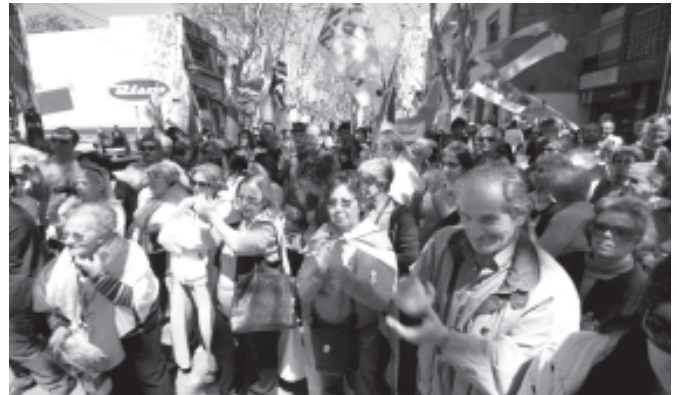
Casa a casa en los barrios, en las ferias, los militantes frenteampistas y los candidatos llevan las propuestas de cambio hacia el próximo gobierno.