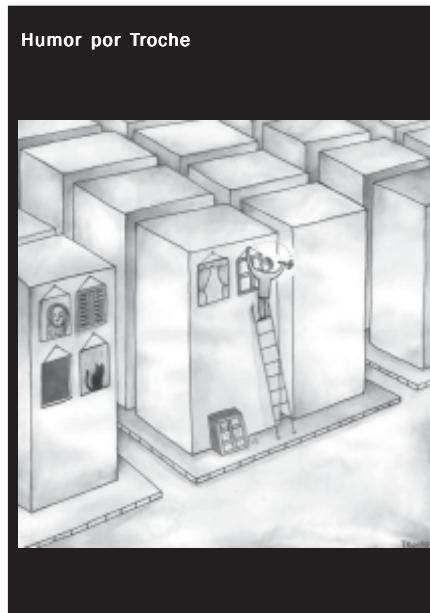
Humor por Troche