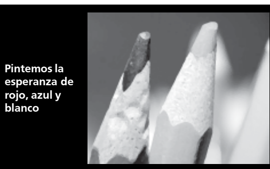
Pintemos la esperanza de rojo, azul y blanco