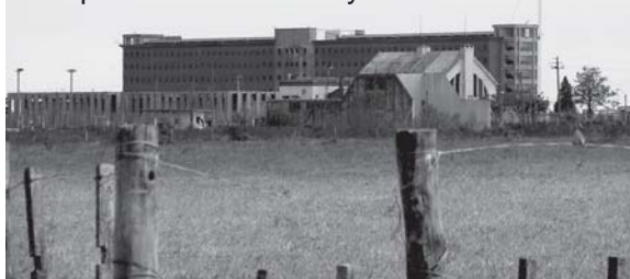
Los penales de Libertad y Punta de Rieles

Para todas y todos, en mayor o menor medida, la cárcel fue una experiencia traumática y dolorosa, que marcó nuestra existencia, nuestra vida, nuestros proyectos futuros y esperanzas colectivas e individuales y familiares. Pero fue también, y lo reivindica el colectivo, una experiencia diaria de lucha por la vida, por nuestras convicciones, con nuestros principios y valores, con nuestros sueños. La cárcel fue el ejercicio diario de la solidaridad hasta límites increíbles, de la fraternidad a toda hora, del apoyo mutuo para sobrevivir. La cárcel fue un lugar de lucha apasionada, de combate, de resistencia frente a los intentos de destruirnos política, física, psíquica, ética y moralmente