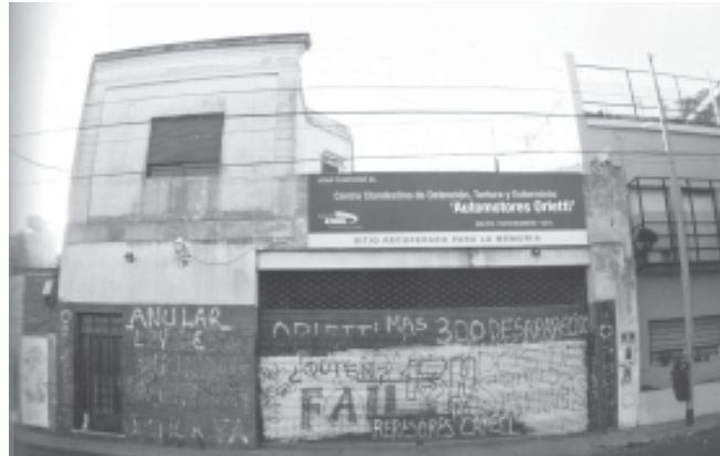
Automotores Orletti, convertido en Sitio Histórico en julio de este año

En la ejecución de la Operación Cóndor en Uruguay confluyeron dos ins-