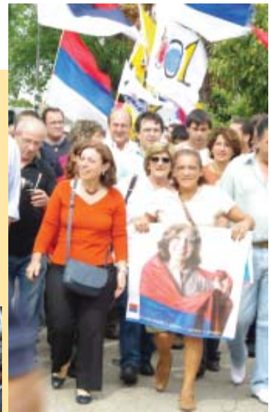
Ana Olivera, la candidata única del Frente Amplio a la Intendencia Municipal de Montevideo comenzó el pasado fin de semana sus recorridos por las distintas zonas de Montevideo. El sábado recorrió algunas calles del Buceco charlando con los vecinos, que le planteron sus preocupaciones en el barrio, terminando en un acto en Pedro Bustamante y Florencia Varela. El domingo por la mañana recorrió la zona del Cerrito de la Victoria, culminando en la feria de Gral. Flores y Serrato. Fue acompañada por el equipo de suplentes a la intendencia, por diputados de los distintos sectores del FA, candidatos a ediles y militantes de las distintas coordinadoras y comités de base.